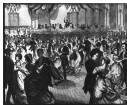
Bal ved det nye kongelige teaters indvielse i 1874.

I forbindelse med teateret var der foruden danseundervisning også almindelig 'læseskole' for skolepligtige børn. Det foregik forskellige steder i byen under private forhold.