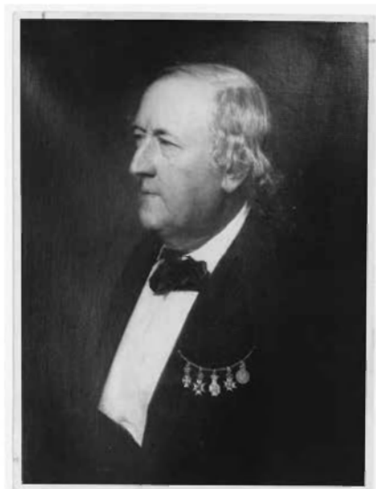
August Bournonville, malet i 1876 af Carl Bloch.

Der kom ofte militærfolk i hans barn-domshjem, og en dag spurgte Oberst Holten forældrene, om de ville lade deres 3. ældste datter Ida (1860-1915) komme ind til balletten, for så ville han tale med sin gode ven Bournonville (1805-1879) om det. Ida kom til prøve og blev optaget i den kongelige ballet, hvor hun dansede i mange år.